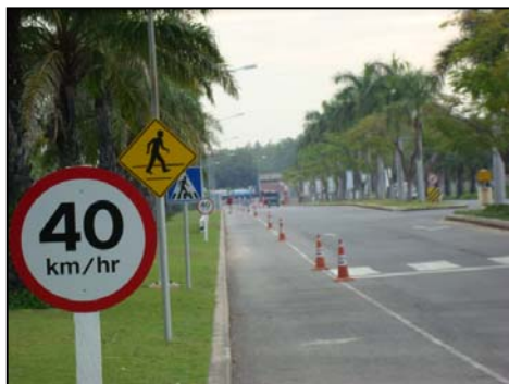
รูปที่ 3-29 ป้ายจำกัดความเร็ว บริเวณอาคารสำนักงาน