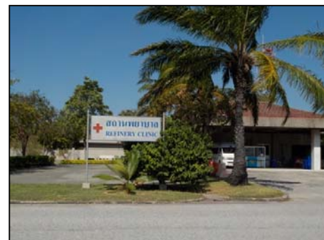
รูปที่ 3-32 สถานพยาบาล

ภาพถ่ายประกอบการปฏิบัติตามมาตรการป้องกันและแก้ไขผลกระทบสิ่งแวดล้อม (ระยะดำเนินการ) โครงการ โรงกลั่นน้ำมัน บริษัท สตาร์ ปิโตรเลียม รีไฟน์นิ่ง จำกัด (มหาชน)