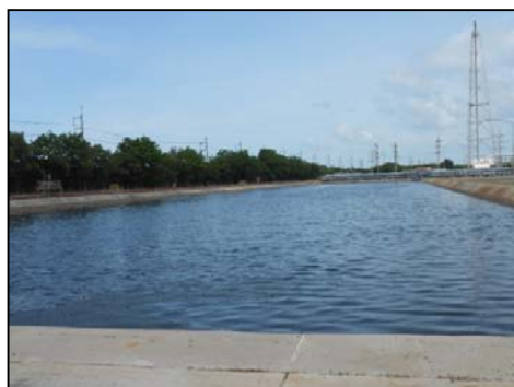
บ่อพักน้ำเสียที่ผ่านการบำบัดแล้ว (Polishing Pond)