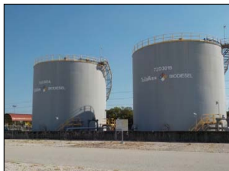
รูปที่ 3-44 ถังเก็บของถัง B100