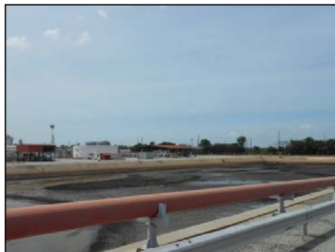
บ่อรวบรวมน้ำฝนที่มีโอกาสปนเปื้อน

(Potentially Contaminated Storm Water Holding Pond)