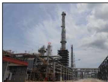
Sulfur Recovery Unit