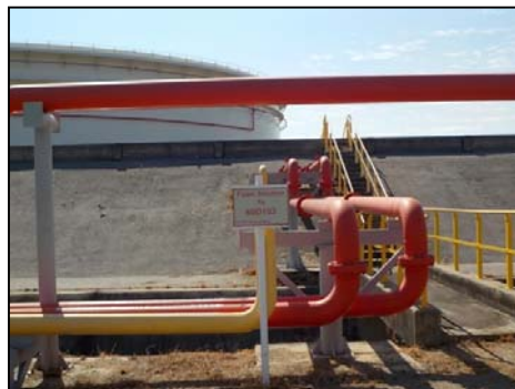
รูปที่ 3-46 ตัวอย่างอุปกรณ์ป้องกันและระงับอัคคีภัย (ต่อ)