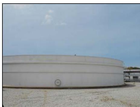
บ่อดกตะกอน