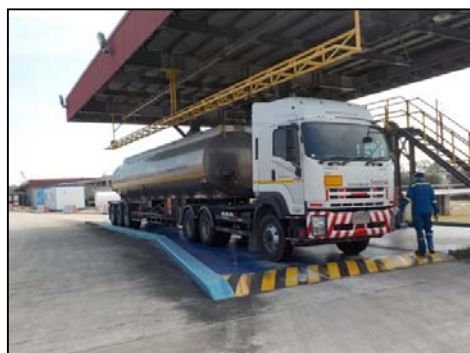
รูปที่ 3-47 สถานีสูบน้ำส่งน้ำมันทางรถ