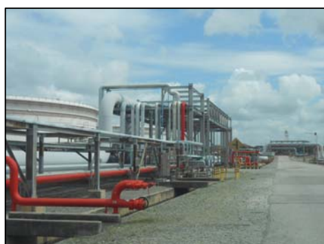
รูปที่ 3-49 Pipe Rack สำหรับท่อขนส่งน้ำมัน