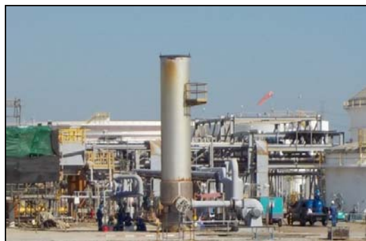
รูปที่ 3-19 ETP Ground Flare