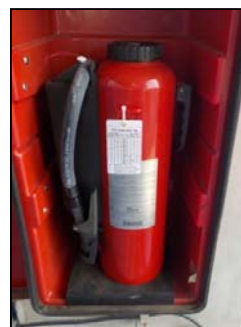
รูปที่ 3-46 ตัวอย่างอุปกรณ์ป้องกันและระงับอัคคีภัย

ภาพถ่ายประกอบการปฏิบัติตามมาตรการป้องกันและแก้ไขผลกระทบสิ่งแวดล้อม (ระยะดำเนินการ) โครงการ โรงกลั่นน้ำมัน บริษัท สตาร์ ปิโตรเลียม รีไฟน์นิ่ง จำกัด (มหาชน)