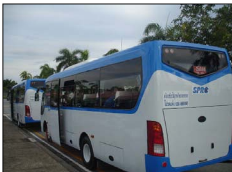
รูปที่ 3-31 รถรับ-ส่งพนักงานและคนงาน