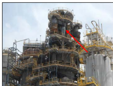
รูปที่ 3-11 Cyclone ที่ RFCCU