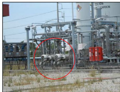
รูปที่ 3-21 Pump/Blower ของ VRU

ภาพถ่ายประกอบการปฏิบัติตามมาตรการป้องกันและแก้ไขผลกระทบสิ่งแวดล้อม (ระยะดำเนินการ) โครงการ โรงกลั่นน้ำมัน บริษัท สตาร์ ปิโตรเลียม รีไฟน์นิ่ง จำกัด (มหาชน)