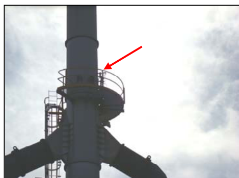
รูปที่ 3-7 Oxygen Analyzer