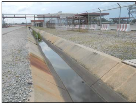
รูปที่ 3-27 รางระบายน้ำฝนแบบเปิด