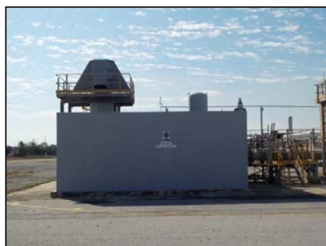
รูปที่ 3-37 Enclosure