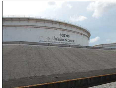
รูปที่ 3-28 คันกั้นบริเวณพื้นที่ลานดักเก็บ