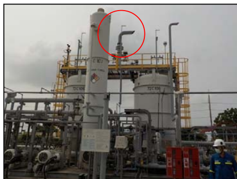
รูปที่ 3-20 Outlet ของ VRU