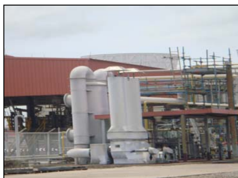
รูปที่ 3-15 Caustic Scrubber