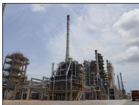
รูปที่ 3-5 HVGO Hydrotreating Unit