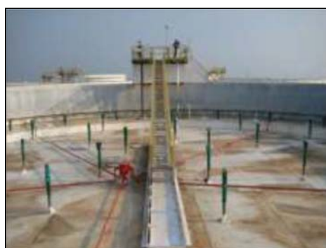
รูปที่ 3-50 ระบบกันระเหย 2 ชั้น (Double Seal) ที่ Floating Roof Tank

ภาพถ่ายประกอบการปฏิบัติตามมาตรการป้องกันและแก้ไขผลกระทบสิ่งแวดล้อม (ระยะดำเนินการ) โครงการ โรงกลั่นน้ำมัน บริษัท สตาร์ ปิโตรเลียม รีไฟน์นิ่ง จำกัด (มหาชน)