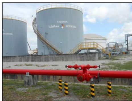
รูปที่ 3-48 อุปกรณ์ป้องกันและระงับอัคคีภัย บริเวณถัง B100