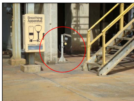
รูปที่ 3-16 H 2 S Detector