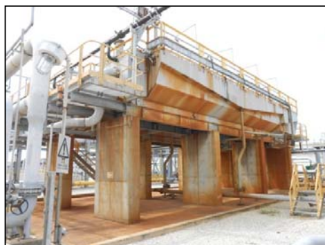
หน่วยแยกน้ำมันออกจากน้ำเสีย