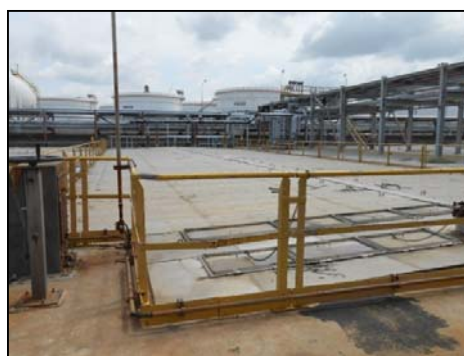
รูปที่ 3-18 ฝापิดที่ API Oil/Water Separator

ภาพถ่ายประกอบการปฏิบัติตามมาตรการป้องกันและแก้ไขผลกระทบสิ่งแวดล้อม (ระยะดำเนินการ) โครงการ โรงกลั่นน้ำมัน บริษัท สตาร์ ปิโตรเลียม รีไฟน์นิ่ง จำกัด (มหาชน)