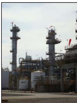
รูปที่ 3-3 Amine Regeneration Unit