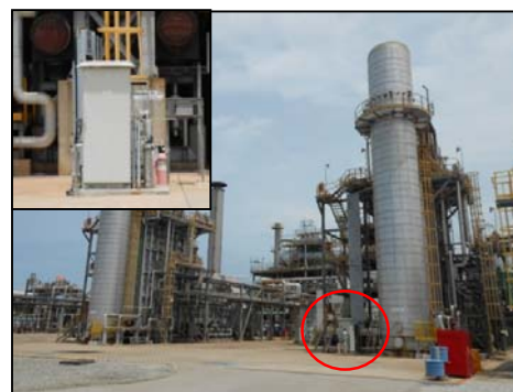
รูปที่ 3-12 CEMS ของปล่อง HRSG

ภาพถ่ายประกอบการปฏิบัติตามมาตรการป้องกันและแก้ไขผลกระทบสิ่งแวดล้อม (ระยะดำเนินการ) โครงการ โรงกลั่นน้ำมัน บริษัท สตาร์ ปิโตรเลียม รีไฟน์นิ่ง จำกัด (มหาชน)