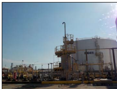
Sour Water Feed Tank