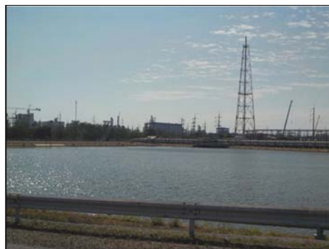
รูปที่ 3-23 บ่อน้ำดับเพลิง