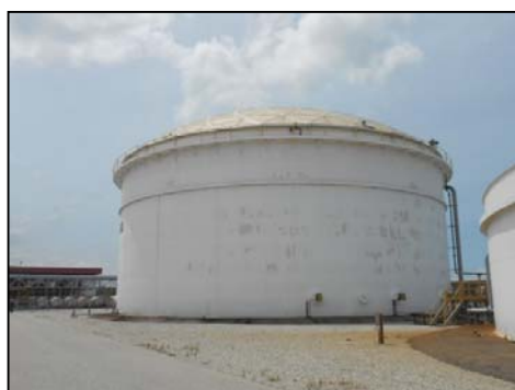
รูปที่ 3-17 ฝารอบถัง Equalization เพื่อลดกลิ่น