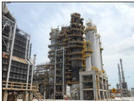
รูปที่ 3-13 DeSO x Catalyst ที่ RFCCU