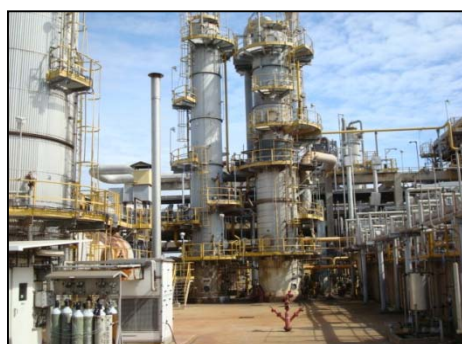
รูปที่ 3-6 Tail Gas Treatment Unit