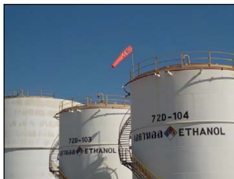
รูปที่ 3-45 Safety Valve และ Water Spray ของถังเอทานอล