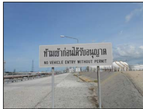
รูปที่ 3-39 ป้ายแสดงเขตพื้นที่หวงห้าม