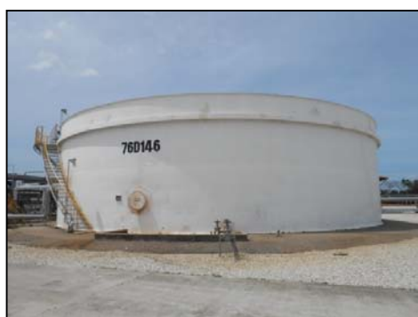
บ่อเดิมอากาศ