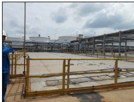
หน่วยแยกน้ำมันออกจากน้ำเสีย

(Potentially Contaminated Storm Water Holding Pond)