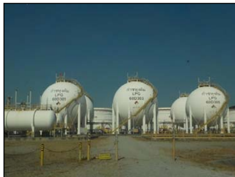
รูปที่ 3-51 ถัง LPG