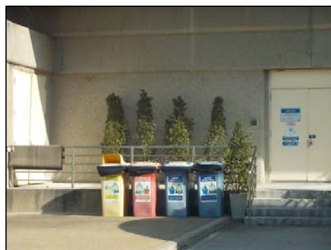
รูปที่ 3-25 ภาชนะบรรจุกากของเสียแยกประเภท