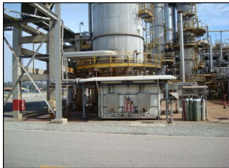
รูปที่ 3-9 CEMS ของปล่อง Tail Gas Treatment Unit