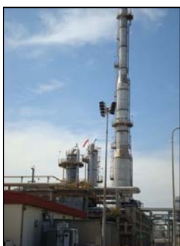
Tail Gas Recovery Unit