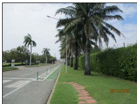
รูปที่ 3-52 พื้นที่สีเขียว

ภาพถ่ายประกอบการปฏิบัติตามมาตรการป้องกันและแก้ไขผลกระทบสิ่งแวดล้อม (ระยะดำเนินการ) โครงการ โรงกลั่นน้ำมัน บริษัท สตาร์ ปิโตรเลียม รีไฟน์นิ่ง จำกัด (มหาชน)