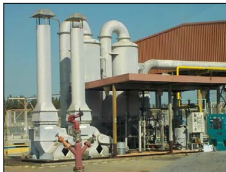
รูปที่ 3-14 Scrubber ที่ Sulfur Tank