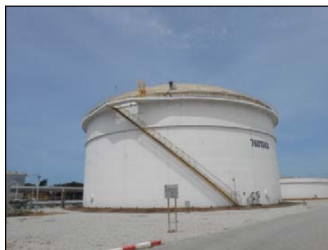
บ่อปรับสภาพน้ำเสียก่อนเข้าหน่วยเดิมอากาศ