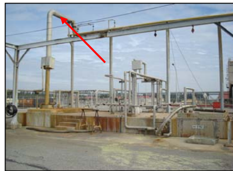
รูปที่ 3-10 ระบบดูอากาศจากบ่อซัลเฟอร์