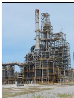
Platformer & CCR