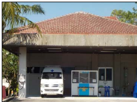
รูปที่ 3-33 รถพยาบาล