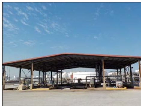
หน่วยบำบัดรวบรวมกากจุลินทรีย์ (Bio-Sludge Digester)