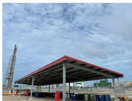
รูปที่ 3-24 พื้นที่พักกากของเสีย