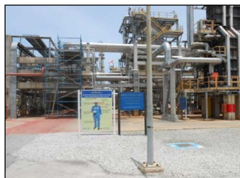
รูปที่ 3-38 ป้ายเตือนสวมใส่อุปกรณ์คุ้มครอง ความปลอดภัยส่วนบุคคล

ภาพถ่ายประกอบการปฏิบัติตามมาตรการป้องกันและแก้ไขผลกระทบสิ่งแวดล้อม (ระยะดำเนินการ) โครงการ โรงกลั่นน้ำมัน บริษัท สตาร์ ปิโตรเลียม รีไฟน์นิ่ง จำกัด (มหาชน)