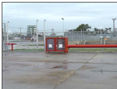
รูปที่ 3-26 อุปกรณ์ป้องกันและระงับอัคคีภัย บริเวณพื้นที่พักกากของเสีย

ภาพถ่ายประกอบการปฏิบัติตามมาตรการป้องกันและแก้ไขผลกระทบสิ่งแวดล้อม (ระยะดำเนินการ) โครงการ โรงกลั่นน้ำมัน บริษัท สตาร์ ปิโตรเลียม รีไฟน์นิ่ง จำกัด (มหาชน)