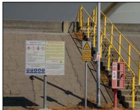
รูปที่ 3-34 ป้ายแสดงข้อมูลความปลอดภัย ของสารเคมี