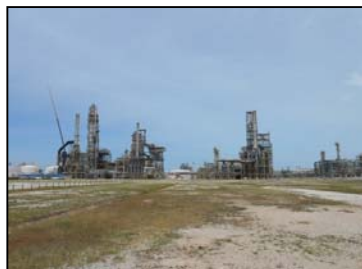
ภาพรวมของโรงกลั่นน้ำมัน