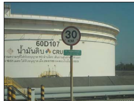
รูปที่ 3-30 ป้ายจำกัดความเร็ว บริเวณกระบวนการผลิต